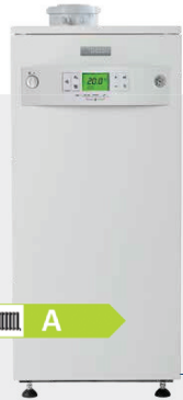
Condens 2000 F και 3000 F

Ο λέβητας προσφέρει την αποδεδειγμένα αξιόπιστη και ανθεκτική ποιότητα που χαρακτηρίζει τα προϊόντα της Bosch, σε ιδιαίτερα ανταγωνιστική τιμή.